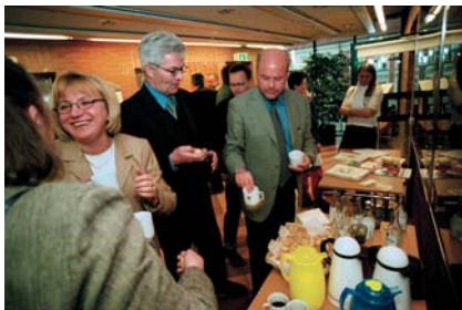
Samarbetet med HSB fortsätter. Det startade med Köpskolan som är succé – här trivsamt samvaro i en paus.

– Skall man hitta medlemsnytta så skall det ha anknytning till boendet och det tycker jag att det här är i alla högsta grad! Fonus juristtjänster är redan förmånliga, med den här rabatten får vi ett oerhört slagkraftigt pris jämfört med hos andra jurister. Och det tycker jag är viktigt för våra medlemmar!