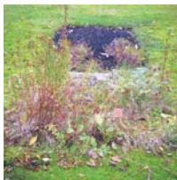
Vanvårdade gravar är ett stort problem som ökar i takt med tiden. Att efterforska vem som är gravrättsinnehavare kostar miljontals kronor varje år.